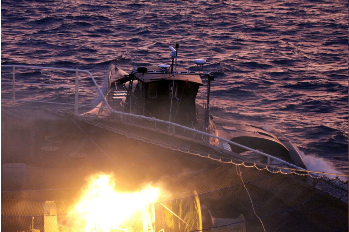
ゴジラ号から発射された落下傘信号弾が調査母船日新丸の船首甲板上で炎を上げて燃える。 (2011年2月9日)