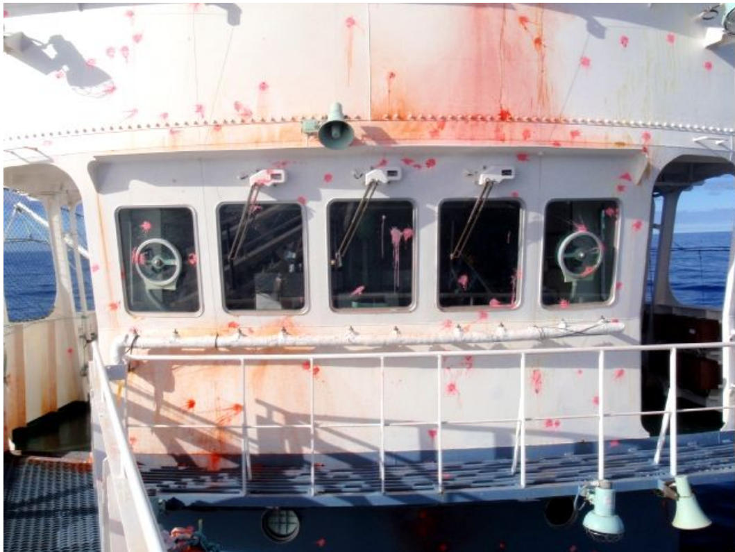
ボブ・バーカー号およびゴジラ号の攻撃を受けた後の第三勇新丸ブリッジ。 エアガンによる着色弾連射を受けた。(2011年2月4日)