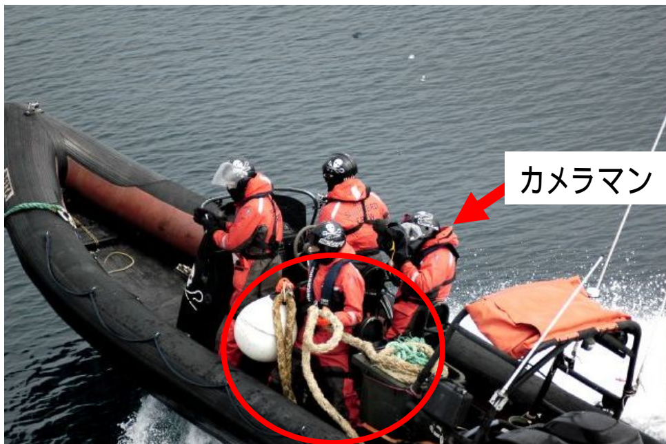
ゴムボートで異常接近し、調査船第三勇新丸のスクリューを破壊・使用不能にしようとロープを流そうとするSS活動家。標的の船舶は航行能力を失い、最悪の場合沈没することもあると豪州の専門家も指摘する危険な行為。 (2011年1月1日)