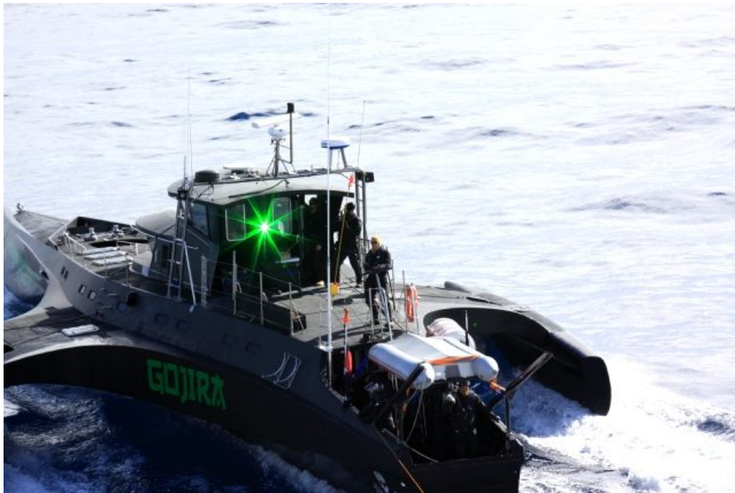
第三勇新丸に対し緑色のレーザー光線を照射するゴジラ号の活動家。 (2011年2月4日)