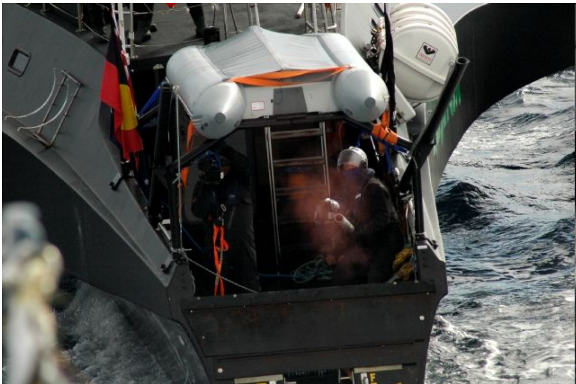
第三勇新丸に対し高圧ランチャーを発射するゴジラ号の活動家 (2011年2月4日)