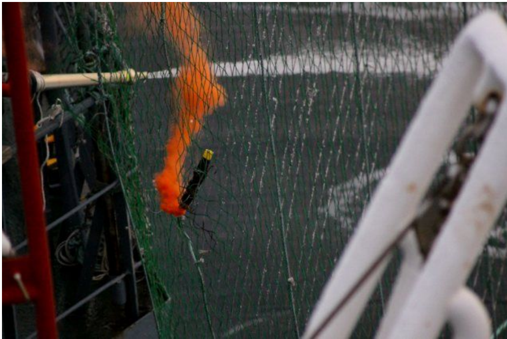
妨害船ボブ・バーカー号の活動家が投てきした発煙筒が第二勇新丸の左舷部防護ネットに着弾。（2011年1月9日）