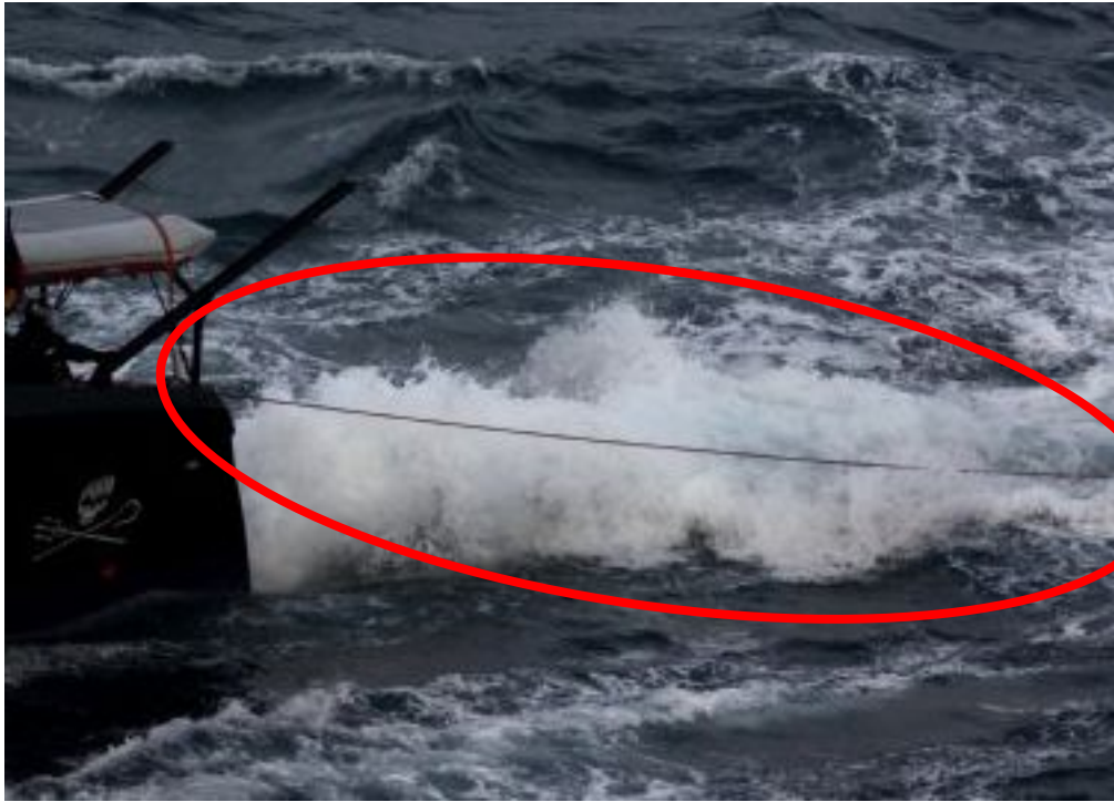
調査船第二勇新丸のスクリュー・舵を破壊・使用不能にしようとワイヤー・ロープを流すSS妨害高速船。この後、第二勇新丸の進路を直前で横切る。(2011年1月5日)