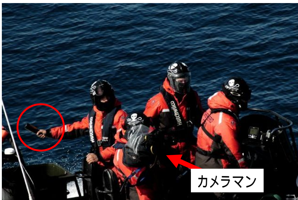
ゴムボートで異常接近し、調査船第三勇新丸に対しピンを投げ込もうとするSS活動家 (2011年1月1日)