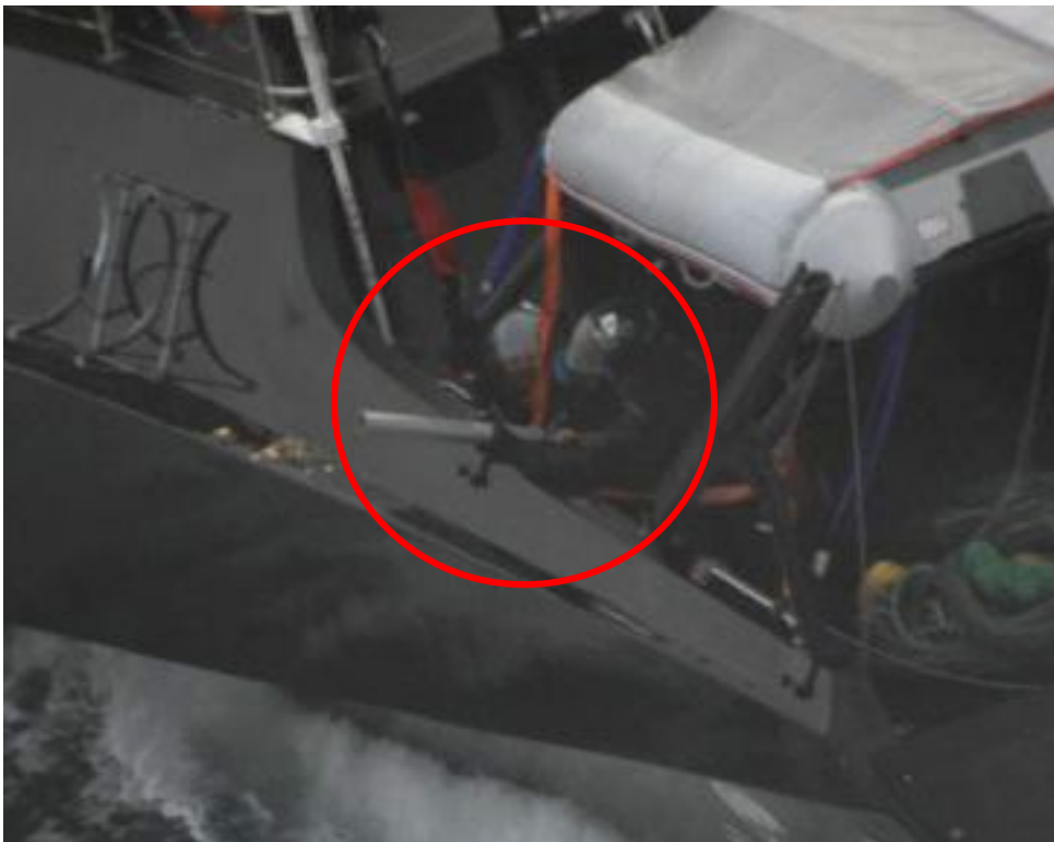
妨害高速船上で高圧ランチャーを構えるSS活動家。第二勇新丸に対しピンなどを高速で発射した。(2011年1月5日)