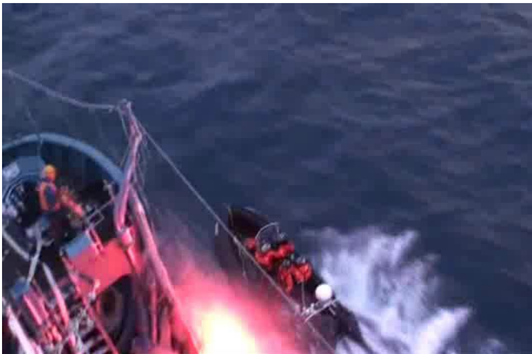
妨害船ボブ・バーカー号の活動家が発光弾で第二勇新丸を攻撃。発光弾は一説には2,000もの炎を発すると言われ、船舶火災のおそれがあり極めて危険。（2011年1月9日）