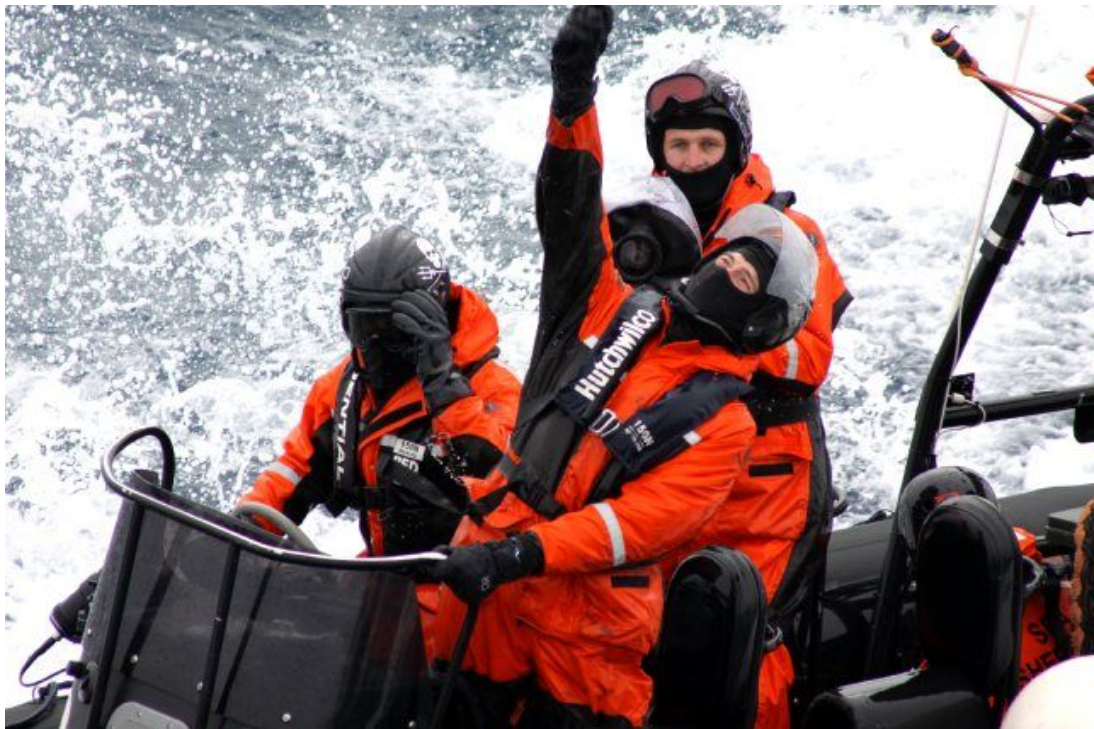
妨害船スティーブ・アーウィン号の活動家が調査船第二勇新丸に対し酪酸の入った瓶を投げ込む。カメラマンがそれを撮影。(2011年1月6日)