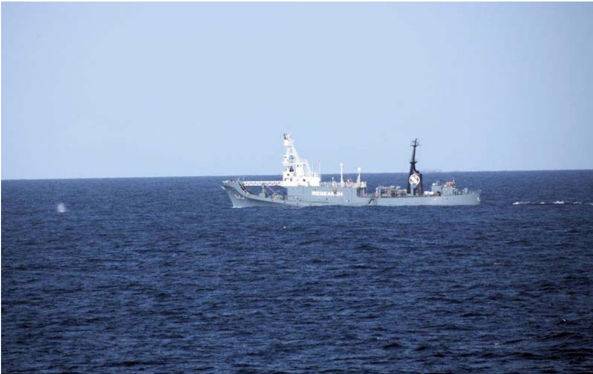
鯨種確認中の目視採集船(勇新丸)