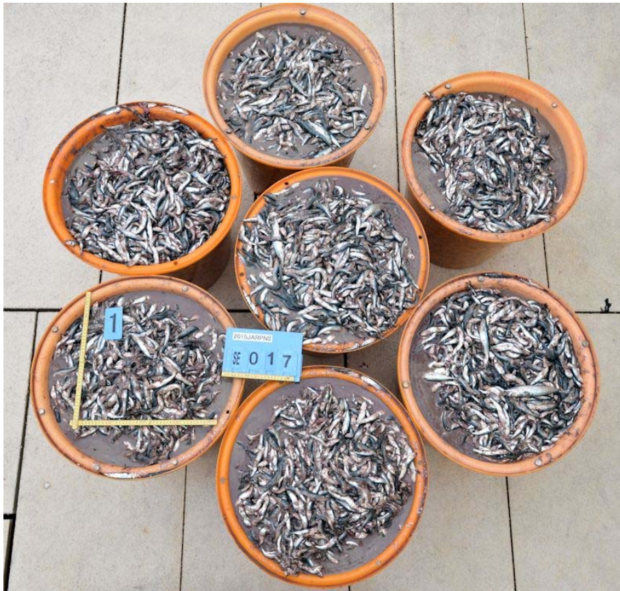
イワシクジラの胃内容物：体長 11-12 cmのマイワシが 815 kg認められた。