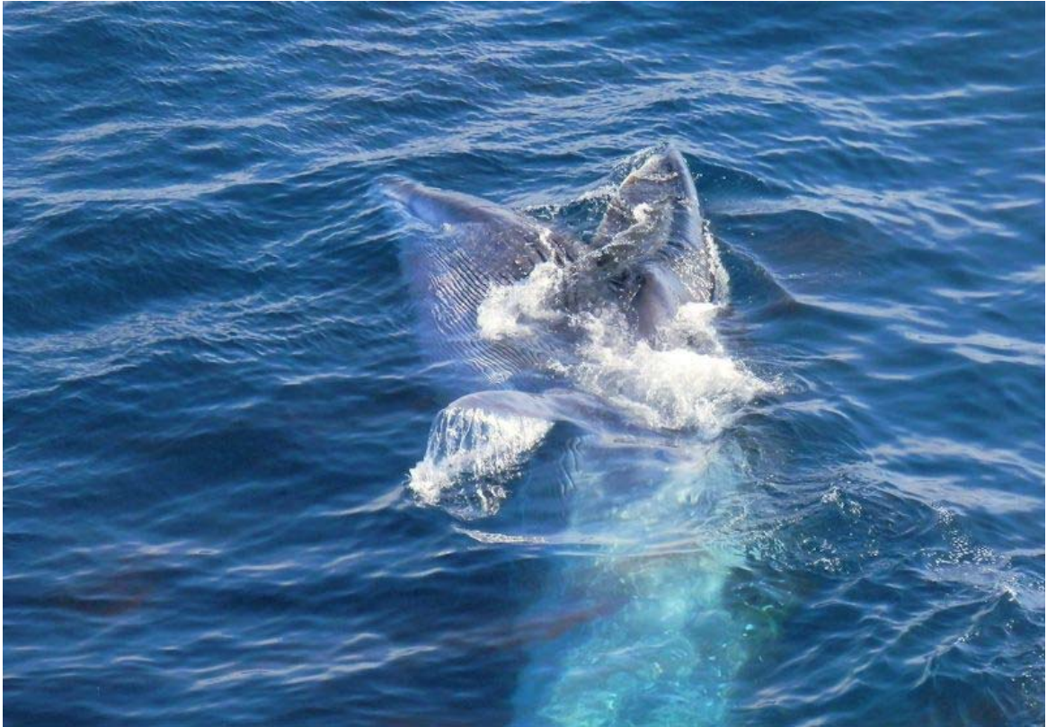
摂餌中のイワシクジラ