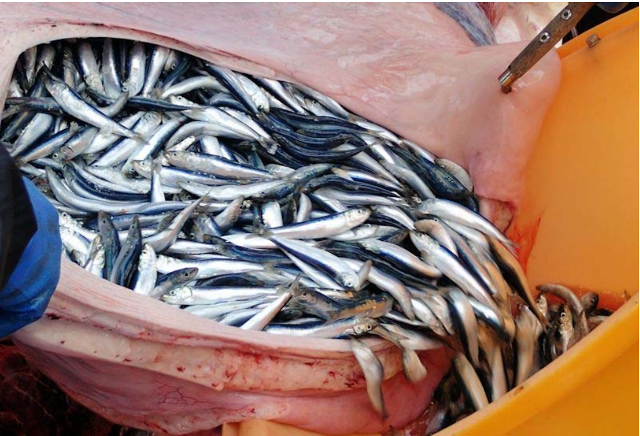
イワシクジラの胃内容物採集風景(上:サバ科魚類、下:マイワシ)