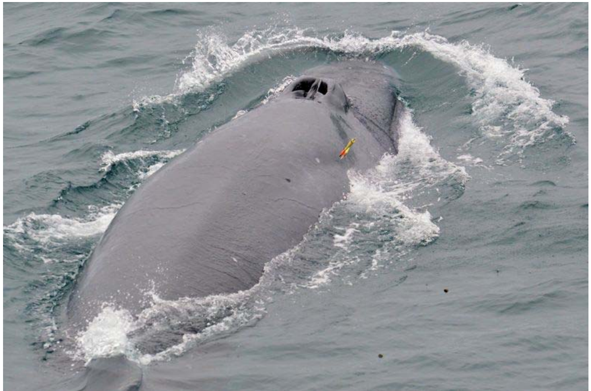
イワシクジラへのバイオプシー採集実験